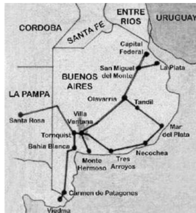
Figura 2: Localización y accesibilidad. Villa Ventana