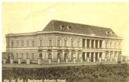
Figuras 2 y 3. Hotel Boulevard Atlántico en sus inicios

En el año 1892, antes de ser inaugurado oficialmente, se convirtió en refugio de inmigrantes judíos que llegaron en diciembre de 1891 exiliados, con el plan de colonización en Entre Ríos. El diseño arquitectónico le permitió transformarse en un inmueble emblemático, con un estilo neoclásico europeo y grandes dimensiones, al momento de su inauguración contaba con 100 habitaciones.