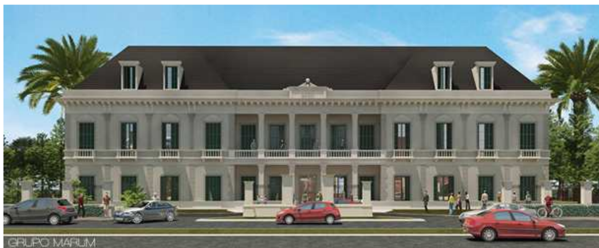
Figura 7: Proyecto de reconstrucción del Hotel Boulevard Atlántico