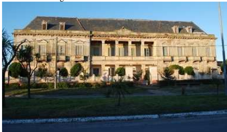
Figura 4: Hotel Boulevard Atlántico

Si bien hubo muchas propuestas de inversores privados con fines netamente comerciales, hasta el momento el municipio no presentó ningún proyecto de recuperación del mismo realzando su importancia cultural. El hotel perdura en forma precaria y su arquitectura se halla deteriorada con riesgo de derrumbes (Figura 4, 5 y 6).