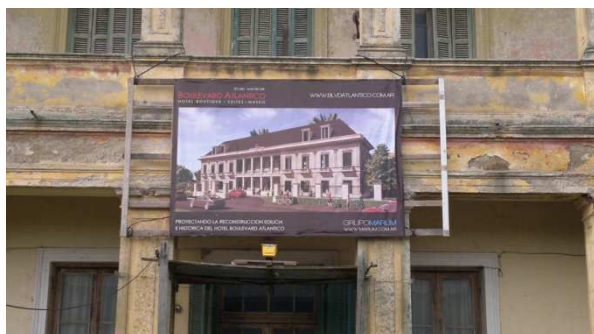
Figura 5 y 6: Hotel Boulevard Atlántico en la actualidad