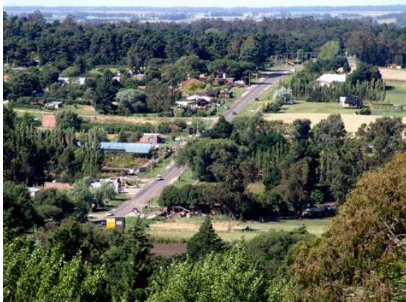
Imágenes N° 10 y 11. Sierra de los Padres