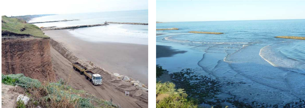
Imágenes N° 2 y 3. Obra defensa costera Playa Los Acantilados

El proyecto consiste en la construcción de un sistema de rompeolas desvinculados de la costa, 110 m. cada uno de longitud, separados entre sí por 130 m., dispuestos en forma paralela a la costa y sin contacto con ella, localizados a 225 m. de la línea de costa, con la intención de disminuir la fuerza del oleaje, descargando allí su energía, para alcanzar la playa con menor intensidad, reduciendo los efectos erosivos (Imágenes N° 2 y 3). El objetivo principal persigue la ampliación de la superficie de arena, mediante la formación de salientes de playa y estabilización de las mismas, de manera de no obstruir el transporte litoral de sedimentos que en ese sector de costa presenta dirección Sur-Norte. Para ello, se prevé la construcción de un sistema de ocho rompeolas rectos aislados (siete en total y uno como prueba piloto de arrecife sumergido multipropósito), dispuestos en forma paralela a la línea de costa.