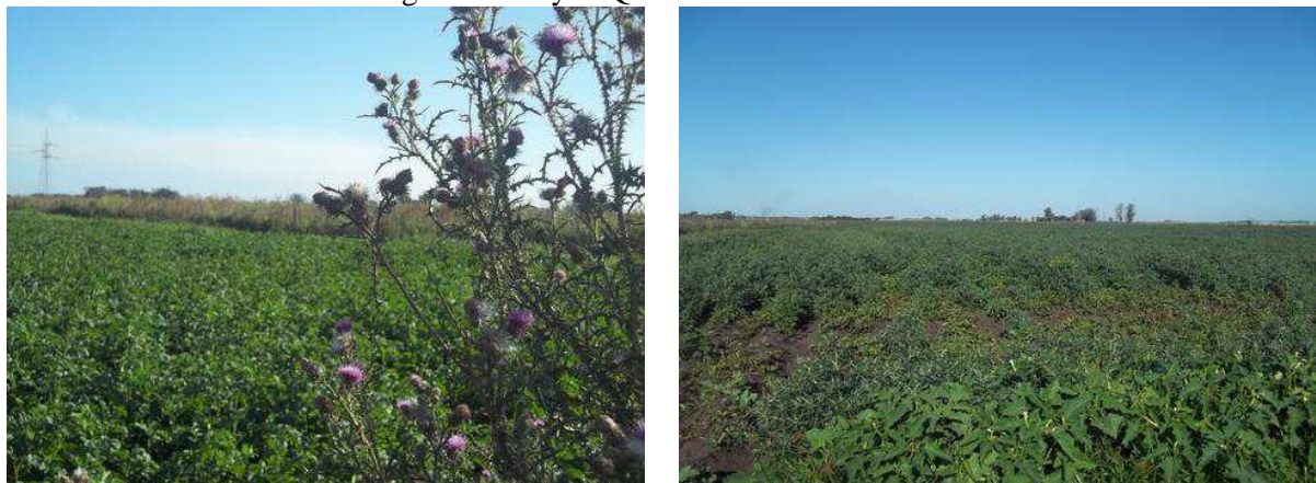
Imágenes N° 5 y 7. Quintas en sector rururbano

A estos aspectos se debe sumar que a partir de 1970 ha ocurrido una incesante evolución y perfeccionamiento en la aplicación tecnológica, como por ejemplo, los cultivos bajo cubierta, el riego por aspersión y/o por goteo, que han generado a través del tiempo y más concretamente hasta el año 2000, una sobreoferta de producción en fresco, incapaz de ser absorbida por los consumidores locales.