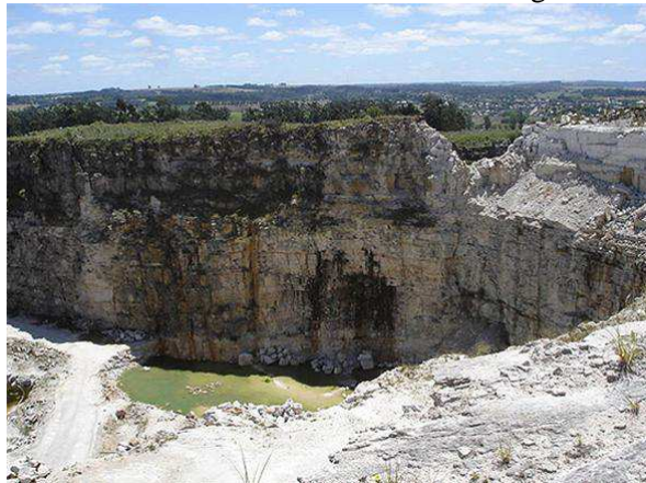
Imágenes N° 4 y 5. Canteras

La producción actual se basa en la extracción y trituración de materiales pétreos: piedra partida y granza para obras viales, lajas para revestimiento de edificios, bloques para aserrar, adoquines para uso de mampostería de piedra, polvo para la industria de vidrio, caolín (arcilla compacta) para las industrias cerámicas.