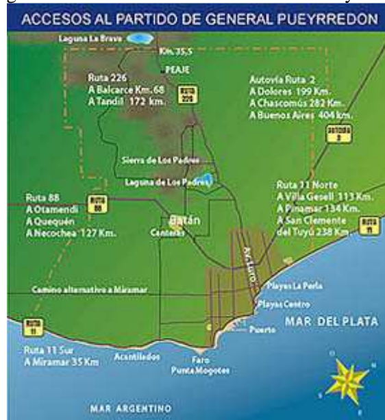
Figura 2. Accesos al Partido de General Pueyrredon

A tal fin, se propone un circuito turístico nodal e integral, basado en la articulación territorial litoral/interior a través del Geoturismo, vinculando la Playa Acantilados (Ruta N°11), el área de Canteras (Ruta N° 88), Quintas frutihortícolas, Laguna y Sierra de los Padres (Ruta N° 226). La expresión nodal plantea la posibilidad de desarrollar actividades de concientización ambiental y turística en cada uno de los atractivos enlazados en el circuito, o bien, concentrarse en uno o algunos de los puntos de interés. El término integral permite lograr una visión completa de los diferentes ambientes y geformas de la región en estudio e incorporar el territorio interior a partir de un itinerario basado en la refuncionalización y valoración turística, que aporta la historia geológica (Figura 2).